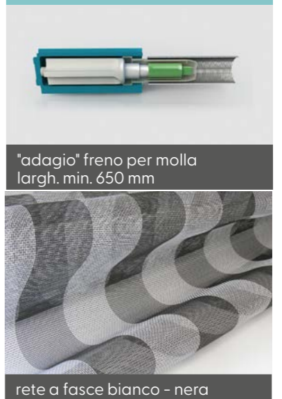
"adagio" freno per molla largh. min. 650 mm