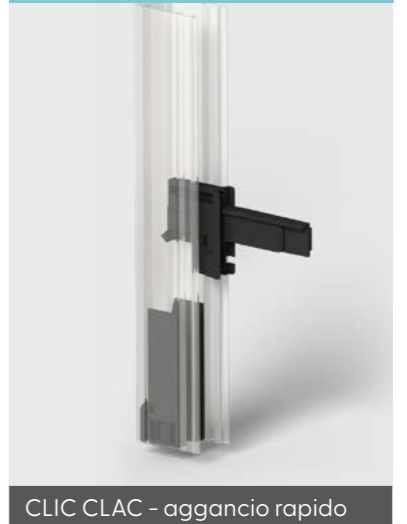
CLIC CLAC - aggancio rapido