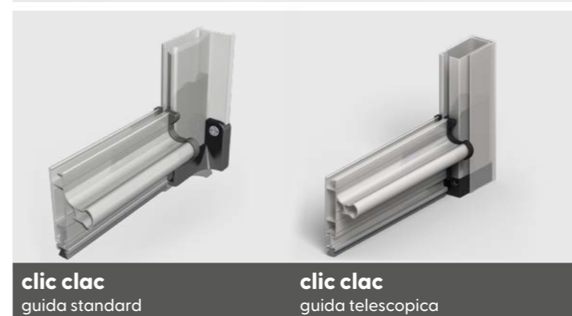
clic clac guida standard