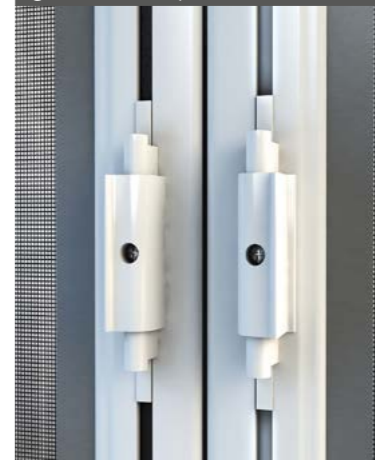
2 ante con cricchetto