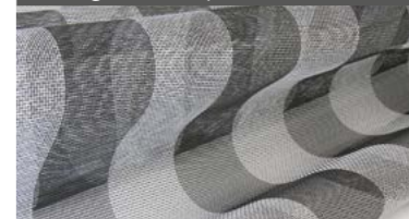
rete a fasce bianco - nera